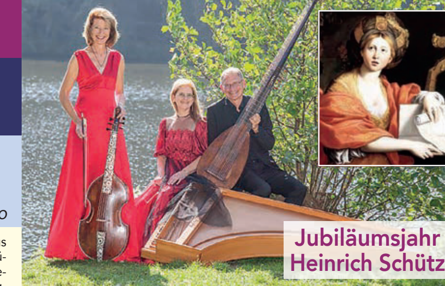
Jubiläumsjahr Heinrich Schütz