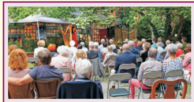
Das TonArt-Sommerfest findet in diesem Jahr als Benefiz-Konzert für die Sanierung und Restaurierung des Prinzenpalais statt.

Suche nach der verlorenen Zeit“, als Verbindung von Rezitation mit kammermusikalischem Vortrag am 23. September in der Landesmusikakademie – ein weiteres Beispiel für eine Veranstaltung, die sich thematisch an alle Vereine der Musikstadt Wolfenbüttel richtet und sich wie viele andere in ein gemeinsames Format hervorragend einfügt. Und weiterhin ist der „Kunstverein Wolfenbüttel“ bei „Atlas of Imaginary places“ am 26. November im Prinzenpalais beteiligt – eine Veranstaltung, in der sich eine grafische Performance mit kreativen Klaviervorträgen live verbindet. In der Hoffnung, dass das Wolfenbütteler Musik- und Kulturleben unter dem Dach der Musikstadt Wolfenbüttel nach Corona weiter floriert und zu neuem Schwung findet, finden Sie auf dieser Doppelseite alle Konzerte bis zum Jahresende (Reihenfolge im Uhrzeigersinn, Beginn rechts oben) , die im Prinzenpalais und dessen Innenhof, in den Kirchen St. Johannis und Beatae Mariae Virginis (ein Konzert in der Braunschweiger Kirche St. Martini), im Garten des Anna-Vorwerk-Hauses, in der Landesmusikakademie sowie in der Augusteerhalle der Herzog August Bibliothek stattfinden werden.