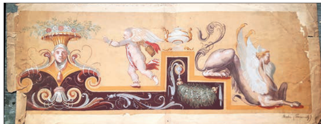
Comedia del Arte Grotteske von Heinemann

Der Besuch des Vortrags ist eintrittsfrei.